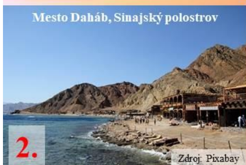
Mesto Daháb, Sinajský polostrov

Egypt sa rozprestiera na 2 kontinentoch: Afrika a Eurázia