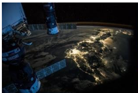
Fotografia z Vesmírnej stanice (ISS)