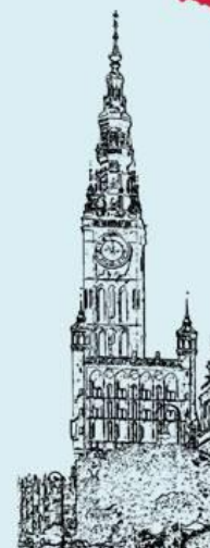
Radnica - Gdańsk